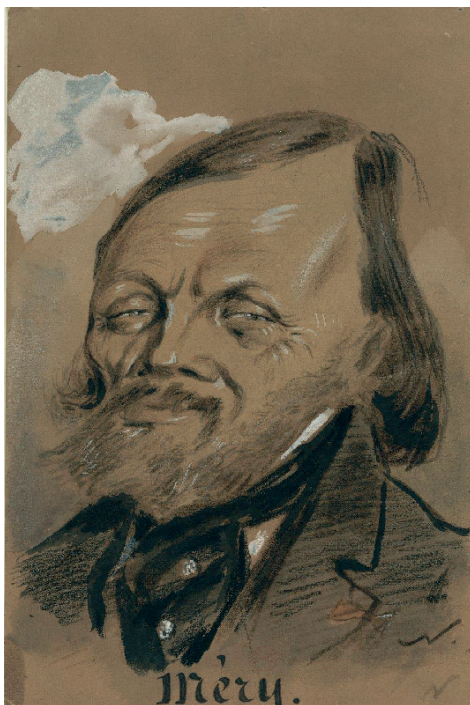
Fig 2 - Joseph Méry, dessin de Nadar.

Contentons-nous de deux exemples qui illustrent bien la portée de la "supercherie" élaborée par Mermet. Dans son ouvrage de vulgarisation, Histoire générale de France depuis les temps les plus reculés jusqu'à nos jours (Paris, 1836) dont le tome I est consacré à la Gaule depuis 1600 av. J.-C. jusqu'en 483 de notre ère, Abel Hugo, le frère de Victor, s'appuie sur le prétendu récit de Trébonius Rufinus, tout en déplorant que Mermet n'ait pas encore publié l'original latin. Évoquant la fondation de Lugdunum, il dresse un tableau des dissensions qui agitent la Gaule après la mort de César : « Le récit de ces dissensions, qui forme un des épisodes les plus curieux de l'histoire de l'Allobrogie pendant les premiers temps de la domination romaine, a été conservé par un auteur presque inconnu dont l'ouvrage a été retrouvé depuis peu d'années seulement » (A. Hugo, III, 1, p. 206). Un article de Cl. Faure, qui compte Mermet au nombre de ses ancêtres 1 , retrace l'histoire de cette fiction littéraire, dans les livraisons du Journal de Vienne , du 24 février (p. 1), du 2 mars (p. 1-2) et du 9 mars 1904 (p. 1-2), à la rubrique « Notes d'histoire viennoise », sous le titre « Trébonius Rufinus et Thomas Mermet » 2 . Il y rappelle dans son second article les propos de A. Allmer 3 : « Un