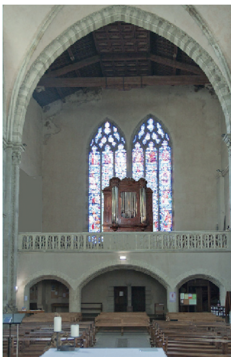
Fig. 3 – Un des projets de positionnement, en discussion

puis finalement récusé sur des arguments esthétiques, historiques et liturgiques. Après restauration l'orgue restera donc sur la tribune. Nous souhaitons une position au centre face à la nef, actuellement discutée puisque masquant en partie le vitrail de Louis-Barthélemy Olivier Mazetier, L'arbre de Jessé 20 .