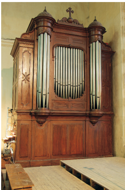
Fig. 1 – L'orgue de Saint-André-le-Bas avant son démontage.