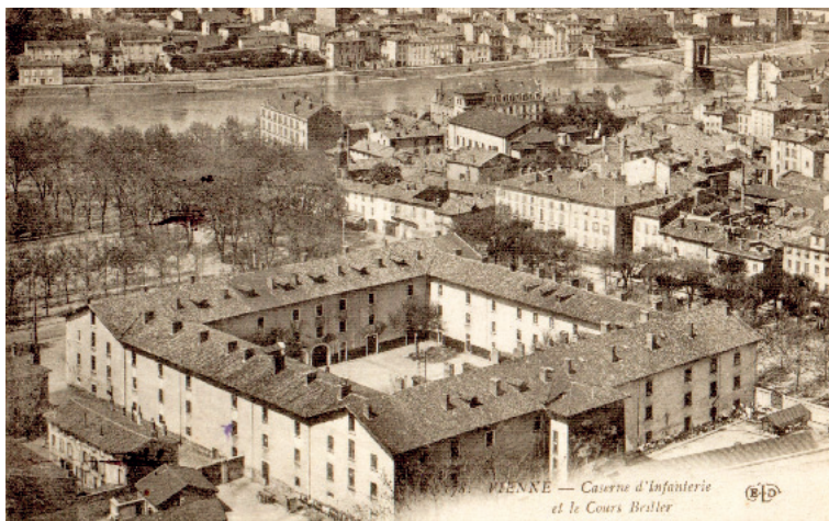
Fig. 6 – Dépôt d'infanterie « Caserne Rambaud » à Vienne (fonds ADV).

débarqué à la gare suivante, après Bruyère. Parti le 27 à 7 heures du matin, nous avons, après avoir marché toute la journée, couché dans un bois. Le 28, fut assez calme car nous étions soutien d'artillerie, nous reçûmes, malgré cela, le baptême du feu. Nous partons le 29 à 5 heures du matin suivant, en empruntant une route encaissée entre deux collines, à huit heures, nous trouvons nos camarades du 99 e . Nous sommes tout près de Saint-Dié, petite ville entourée de crêtes élevées, un seul passage, la vallée, que nous occupons.