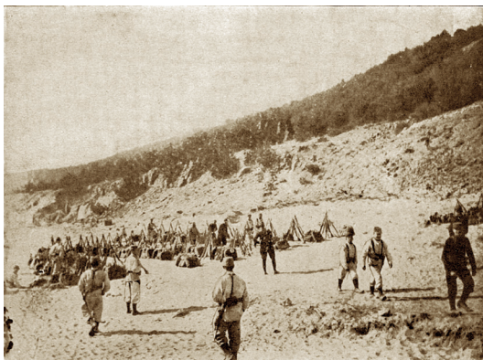
Fig. 9 – Le camp d'entraînement de Bollène dans le Vaucluse ( Vienne et la Guerre ).