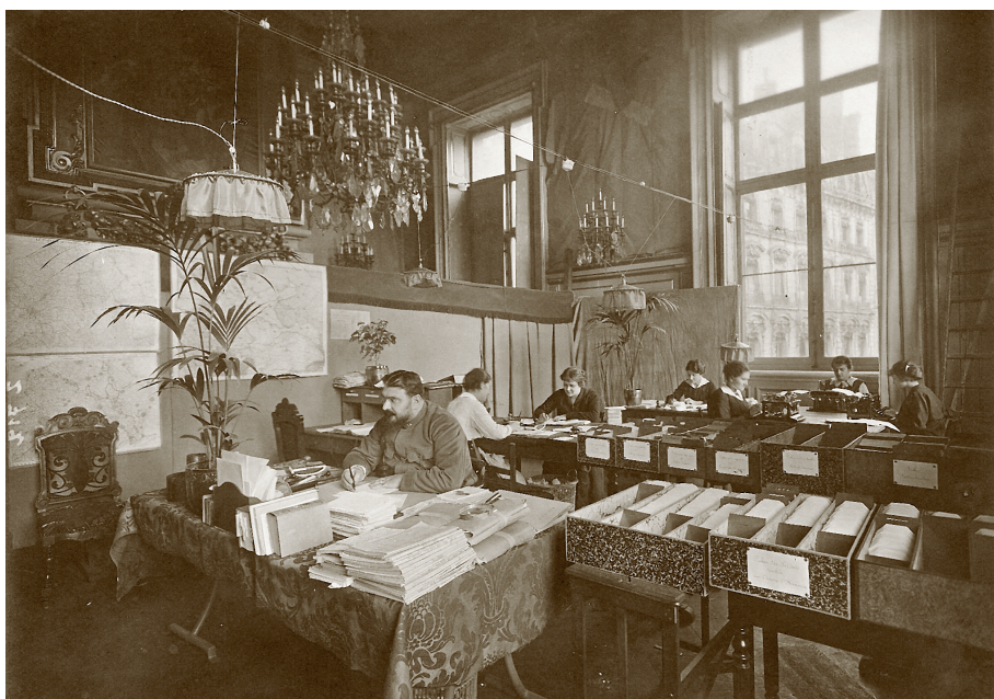
Fig. 12 – Photo du service de recherche à la mairie de Lyon.

Ainsi donc un peu plus d'un an après la disparition de son mari, Madame Hélène Dupinay aura eu enfin une réponse à ses recherches et obtint une toute petite compensation pour élever sa fille et faire vivre sa petite exploitation ; elle ne se remaria pas.